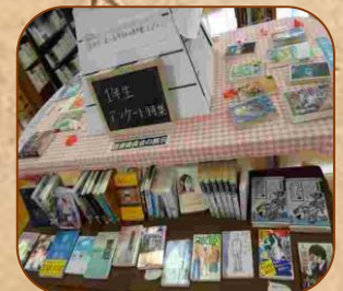
アンケート関連の展示