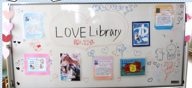
「Library News No.114」