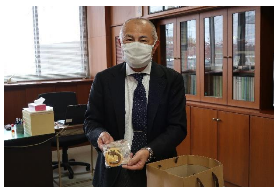
記念品を受け取る各務代表取締役