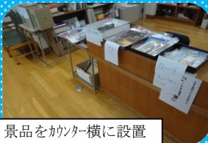
景品をカウンター横に設置